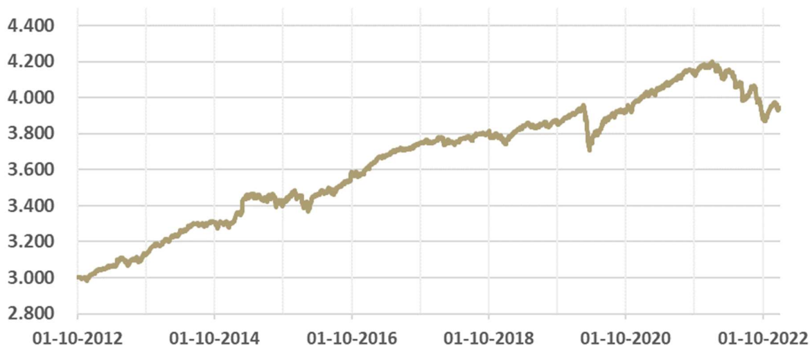
Figur 1: Daglig indre værdi for Investeringselskabet Artha Safe A/S fra oktober 2012.

Selskabets indre værdi pr. aktie blev i 2022 reduceret fra 4.188 kr. primo til 3.944 kr. ultimo 2022 svarende til et fald på 5,83 %.